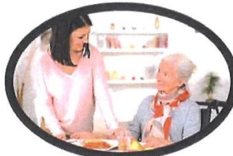
Livraison de repas à domicile

Vous avez 75 ans et plus ? Votre caisse de retraite complémentaire Agirc Arrco vous propose des chèques SORTIR PLUS pour financer vos déplacements avec notre service de TRANSPORT ACCOMPAGNÉ