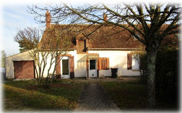
Logement 12 rue de l'ancien presbytère

En attendant, la MAM s'installera au 12 rue de l'Ancien Presbytère, dans le logement communal, où elle accueillera les enfants dès cette année.