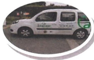
Véhicule aménagé pour transporter des personnes à mobilité réduite