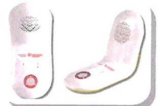
Matériel de téléassistance

*Crédit d'impôt de 50 % des dépenses effectuées dans le cadre de la loi de finances pour les personnes non imposables sur le revenu