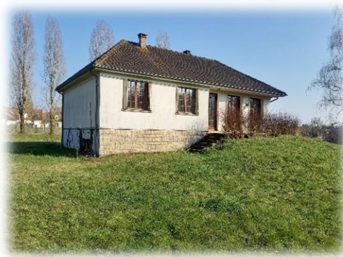
1 rue des Bourdinières – future MAM